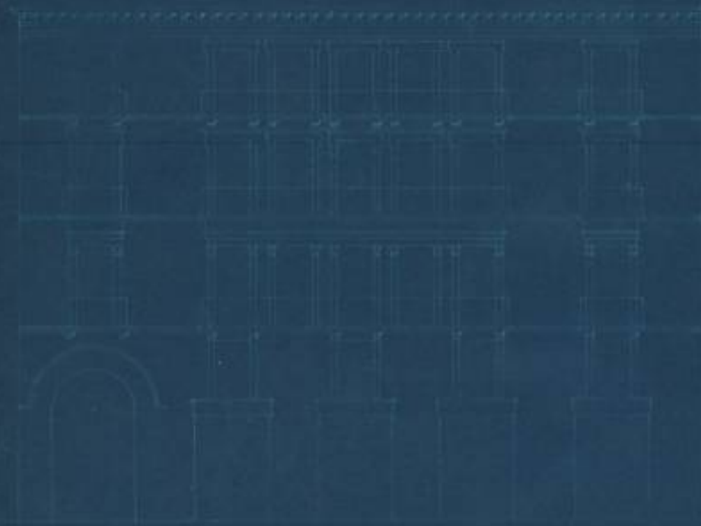
Fachada a la Plaza de la Constitución