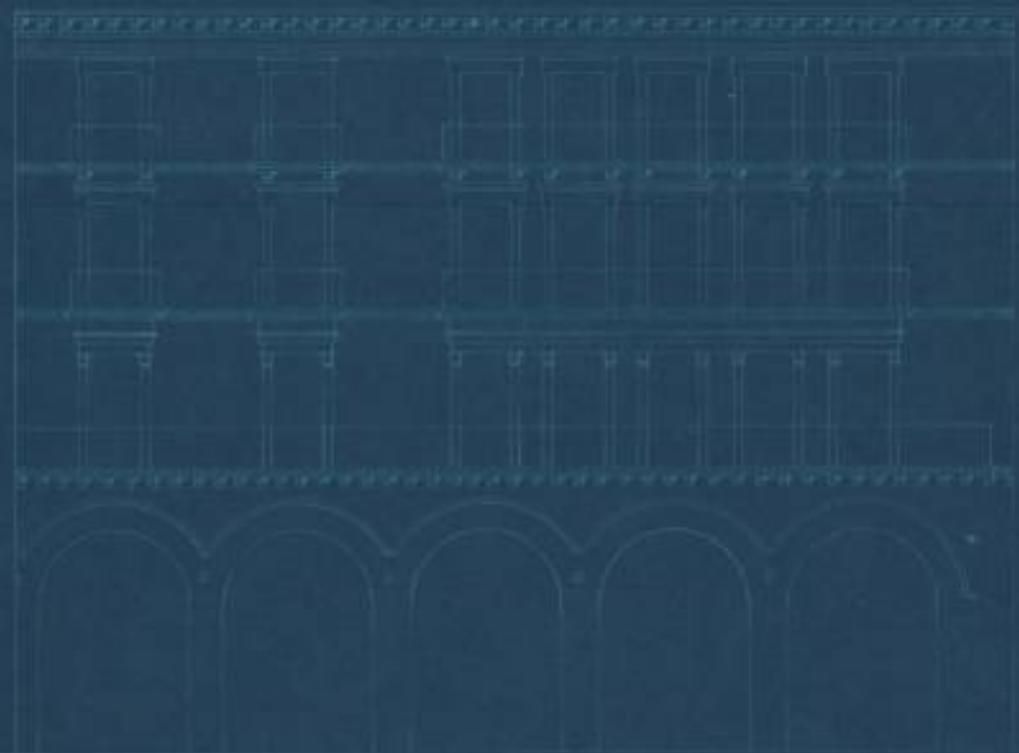
Fachada a la Calle de la Independencia