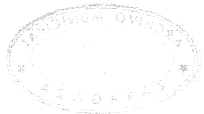
DETALLE DEL PRETIL DEL PASEO DEL EBRO.