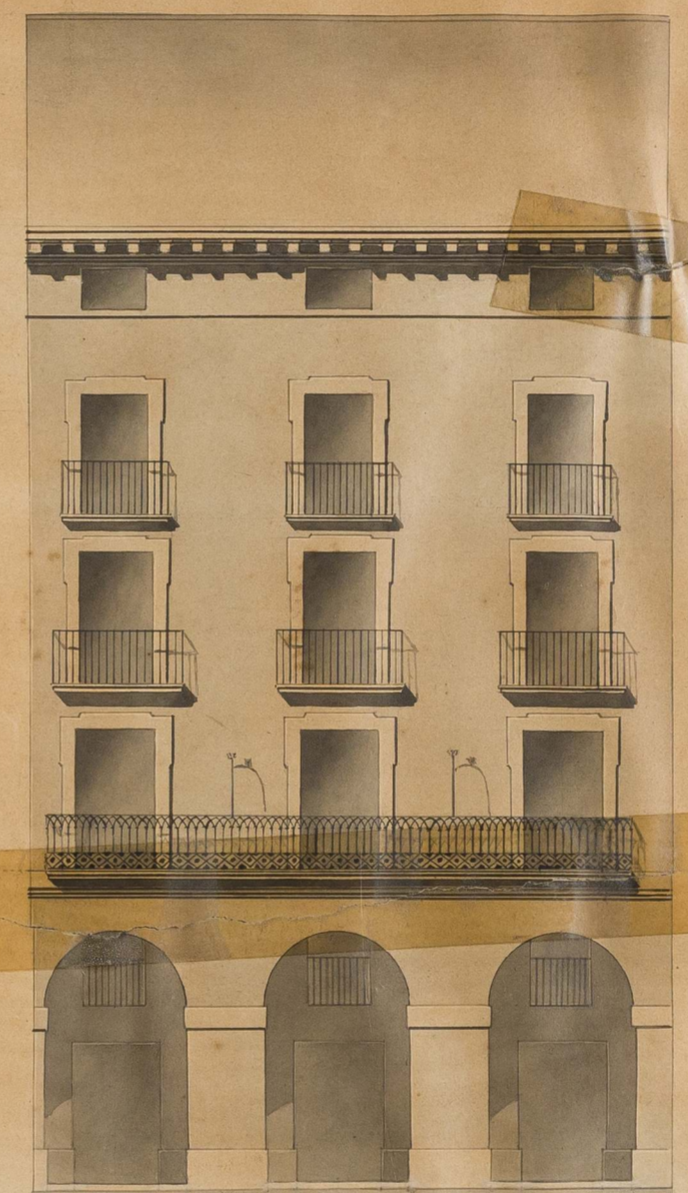
Fachada a la Plaza del Mercado, cuyos vanos se han fijado con sujeción a los Porches de las Casas contiguas para que resulte un todo arreglado.

Escala & 0 5 10 20 30 40 50 Pies Castellanos.