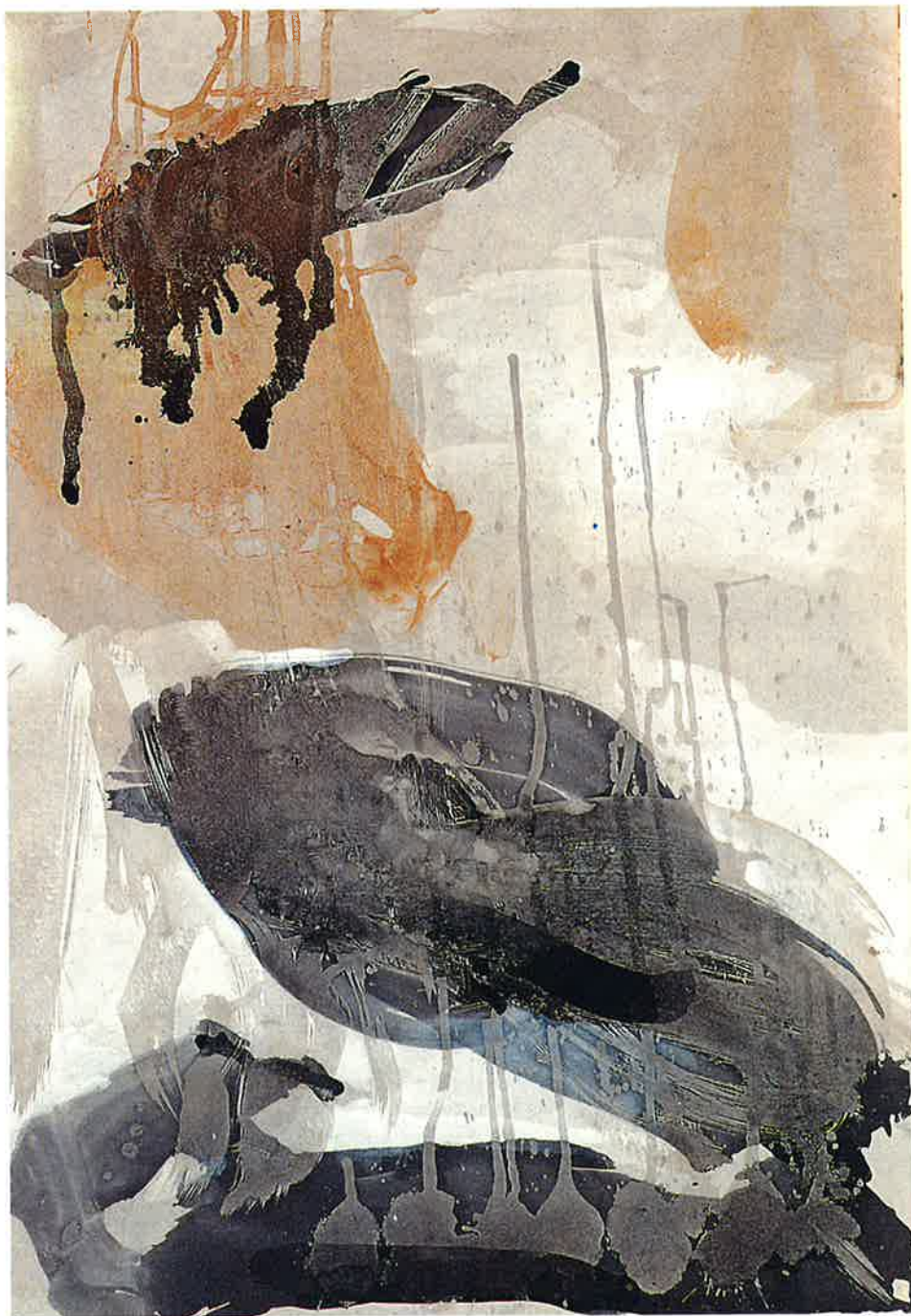
Huellas , 1994 Mixta sobre cartón, 75 x 52