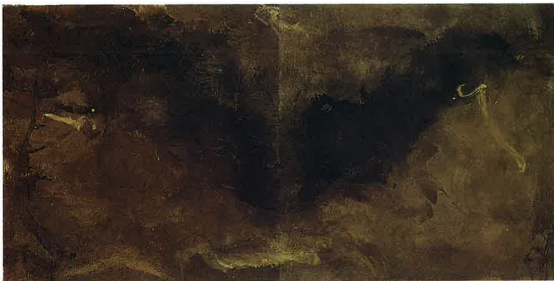
Pintura , 1994 Mixta sobre lienzo, 150 x 300