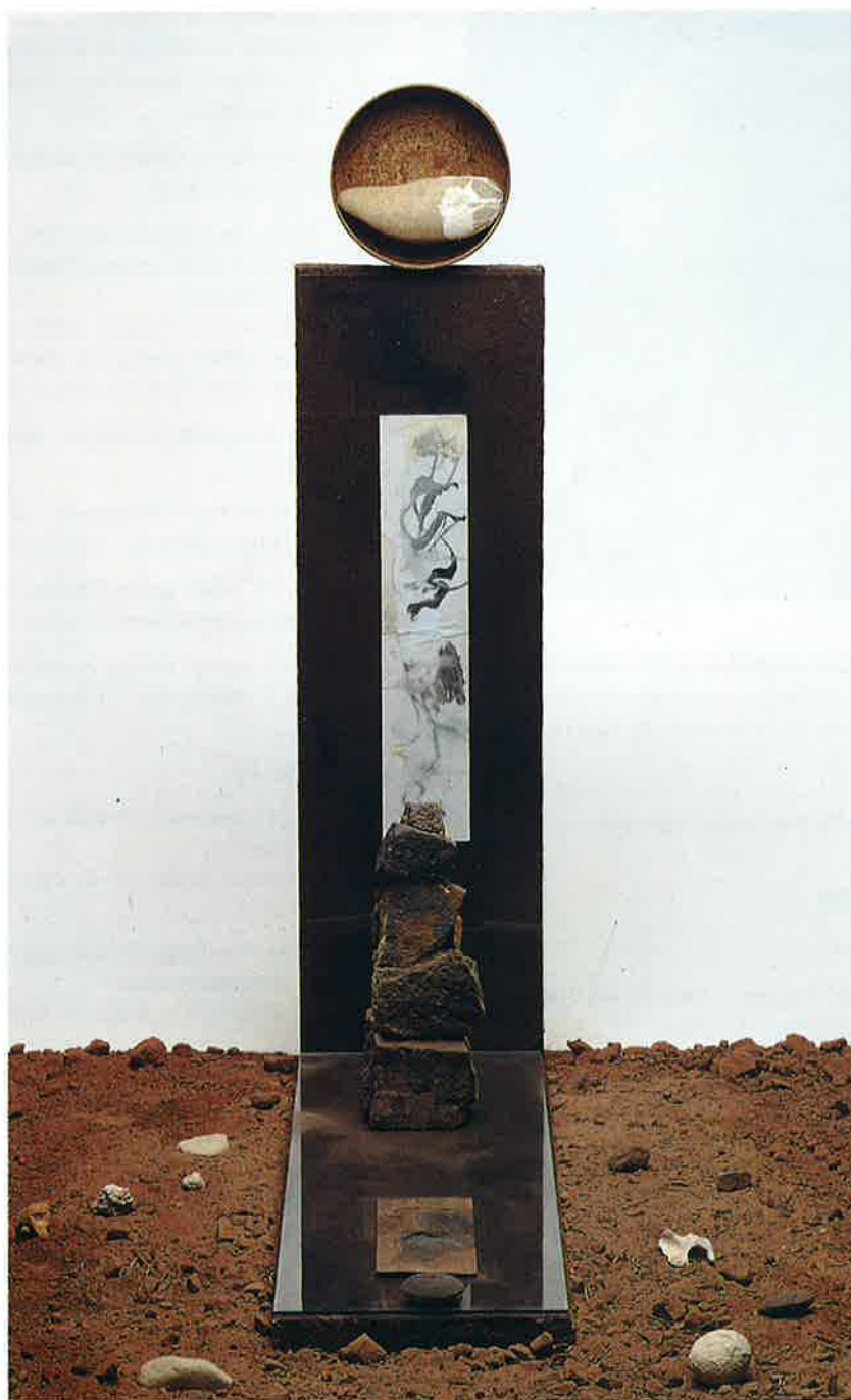
Estela de Albarracín (detalle) , 1994 Mixta, 125 x 30 x 100