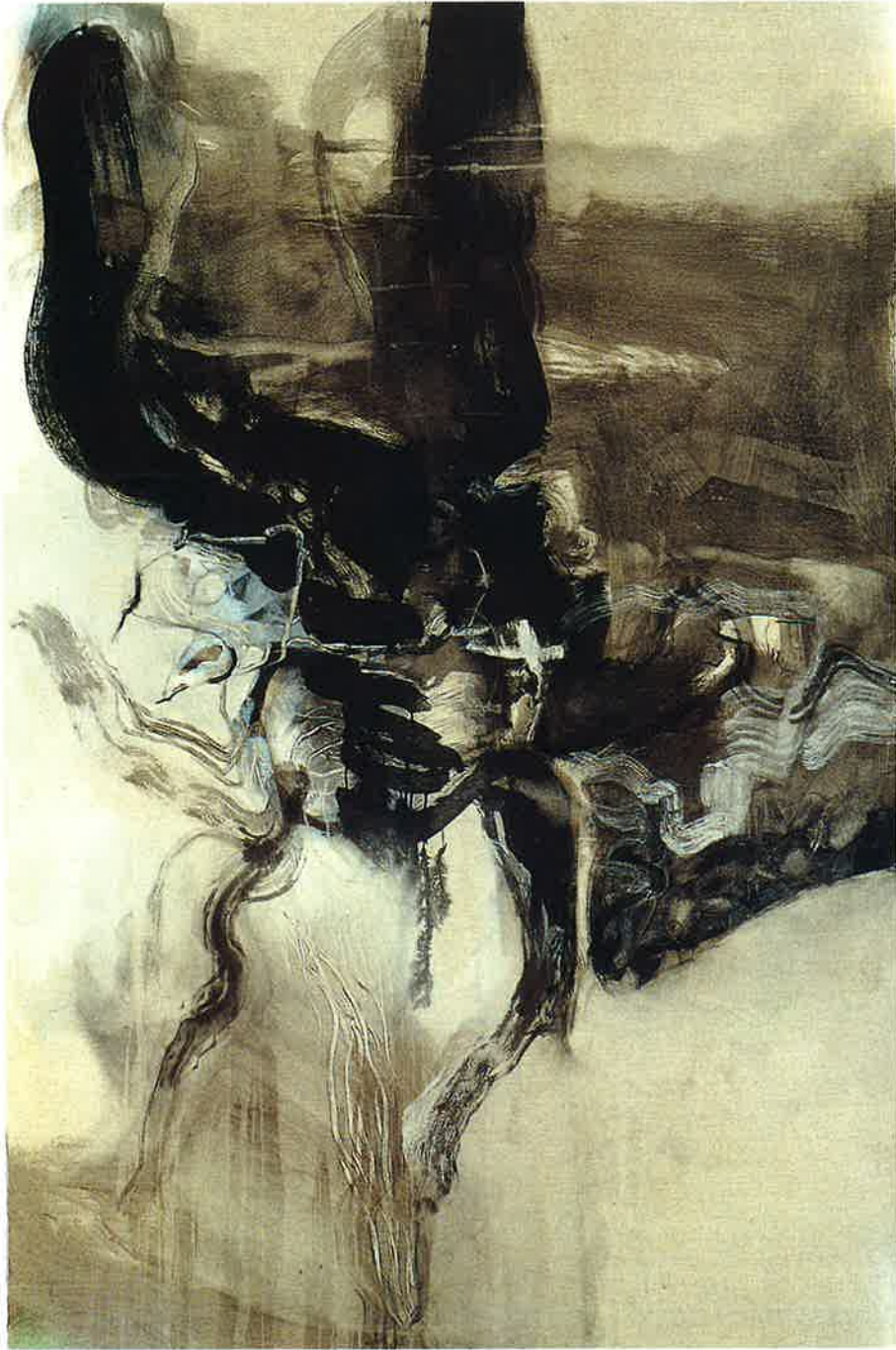
Estela de almas (detalle) , 1993 Mixta sobre lienzo, 195 x 130