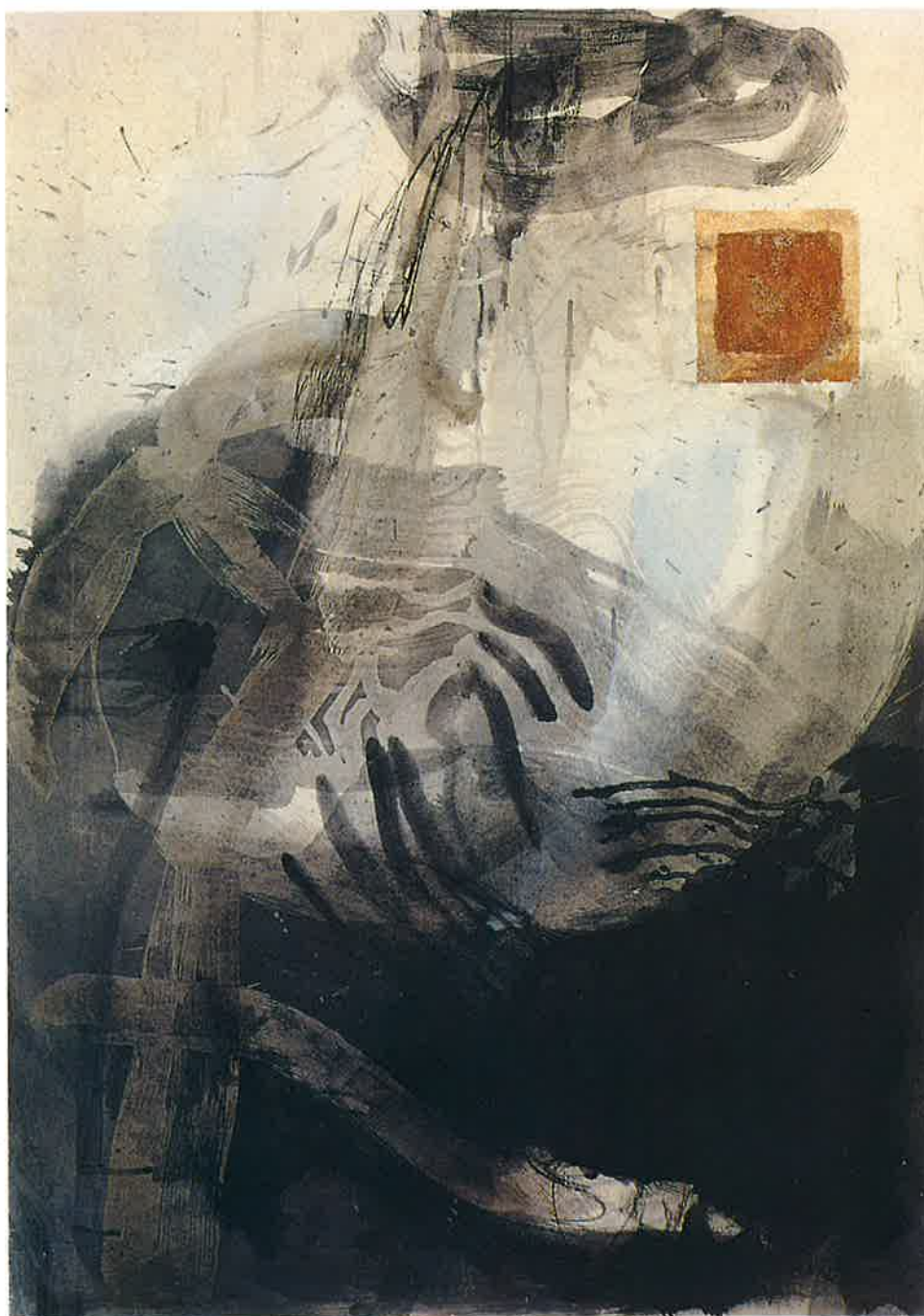
Huellas , 1993 Mixta sobre cartón, 105 x 75