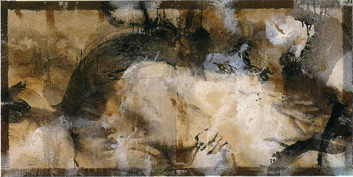
Pintura , 1994 Mixta sobre lienzo, 150 x 300