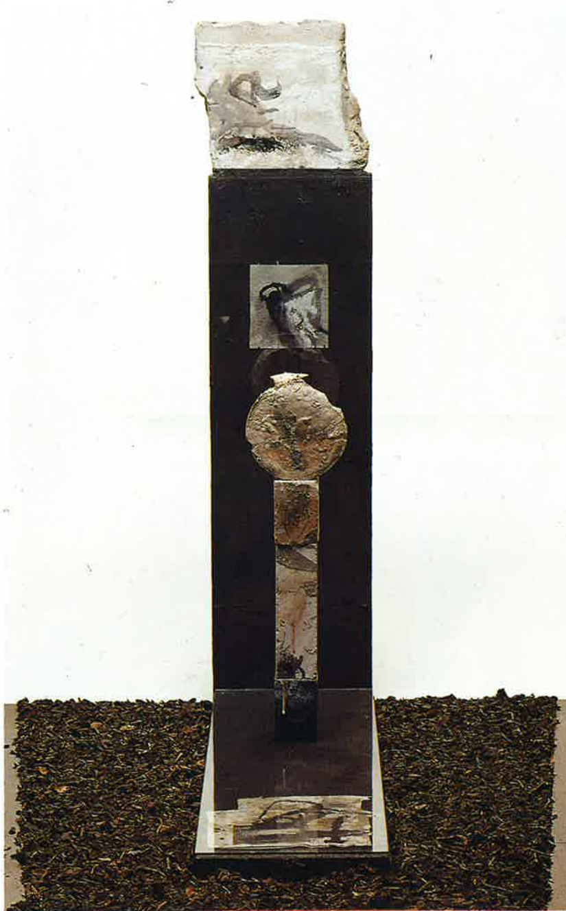
Estela de almas (detalle) , 1994 Mixta, 127 x 30 x 100