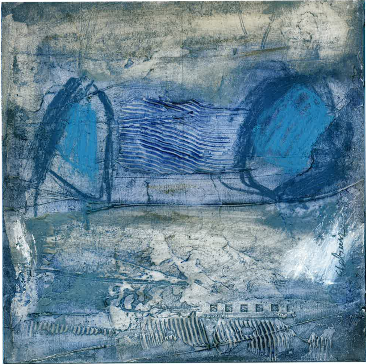
Los cuarenta bramantes , 2011. Óleo y pastel sobre cartón, 30 x 30