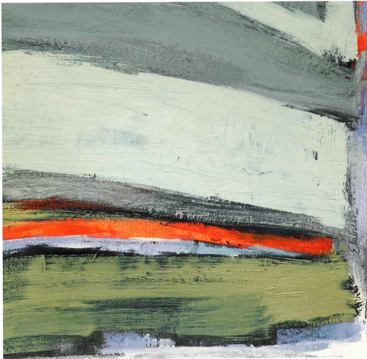
En aguas internacionales , 2012. Óleo y pastel sobre cartón, 30 x 30