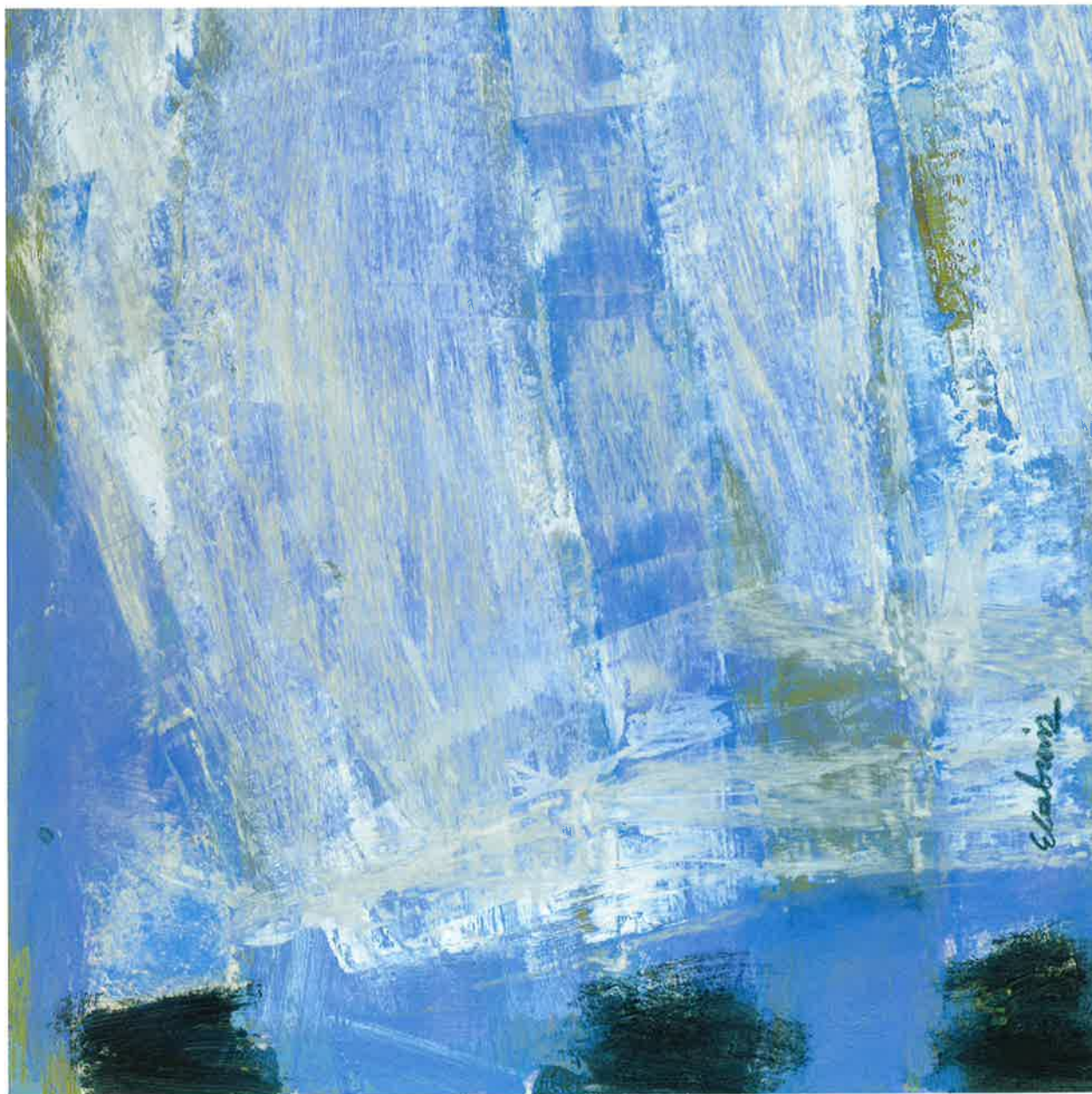
Corriente de Humboldt , 2012. Óleo y pastel sobre cartón, 30 x 30