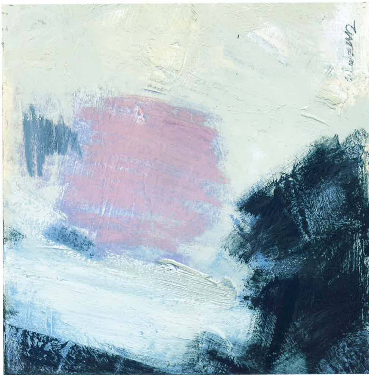
Escarceos y rizos de superficie , 2011. Óleo y pastel sobre cartón, 30 x 30