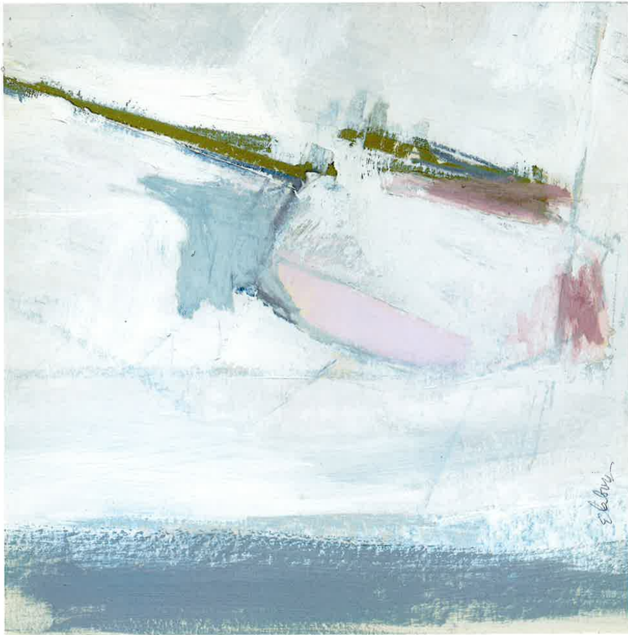
Zona de aguas someras , 2012. Óleo y pastel sobre cartón, 30 x 30