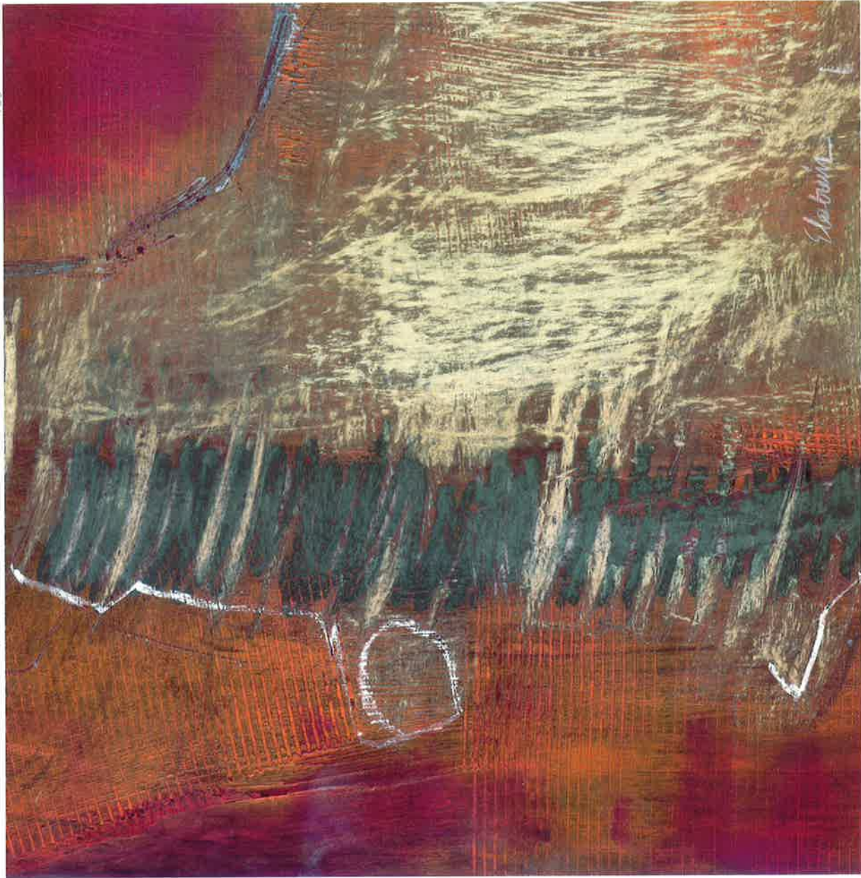
Arrecifes , 2010. Óleo y pastel sobre cartón, 30 x 30