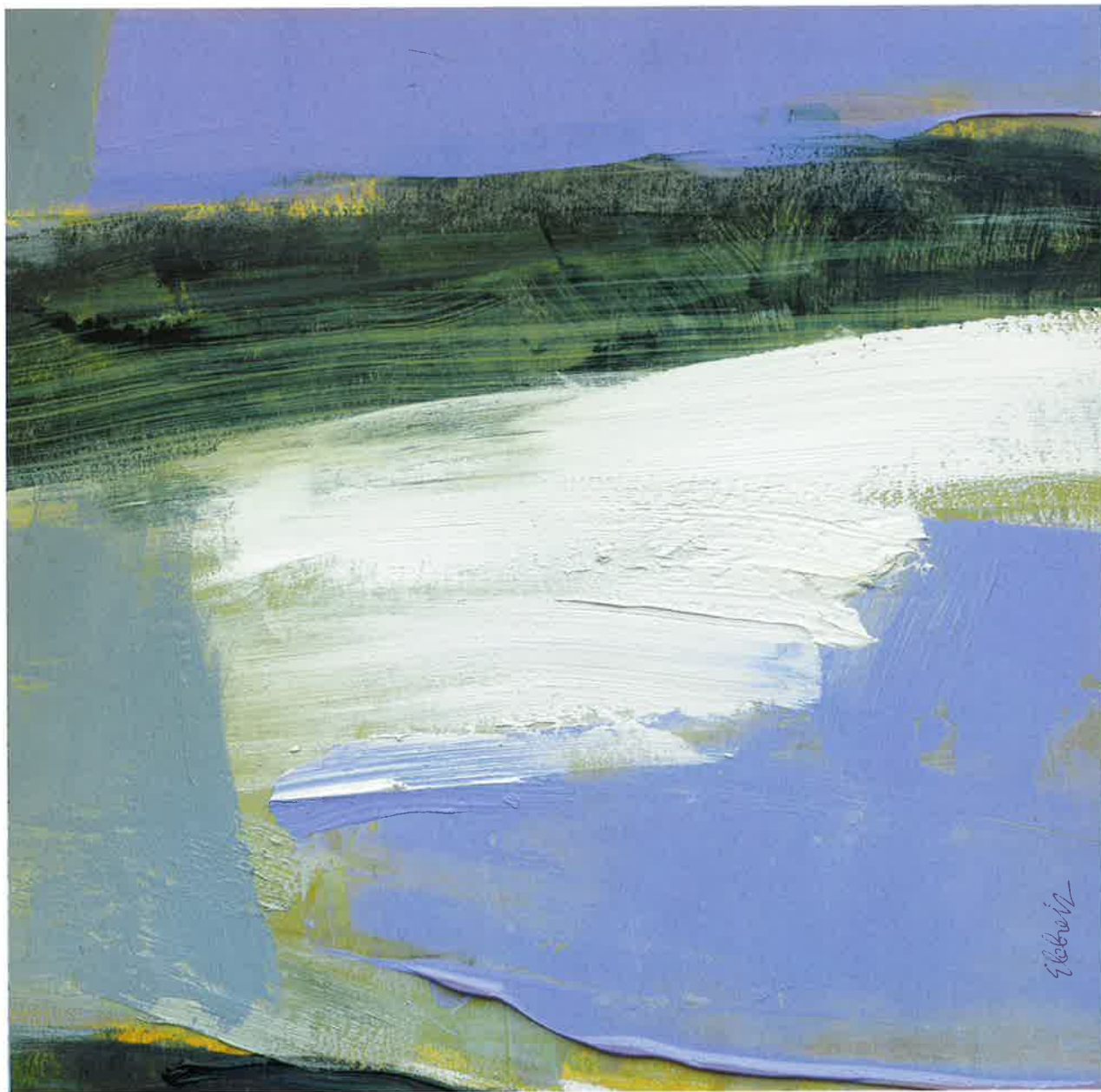
En aguas internacionales , 2012. Óleo y pastel sobre cartón, 30 x 30 clu