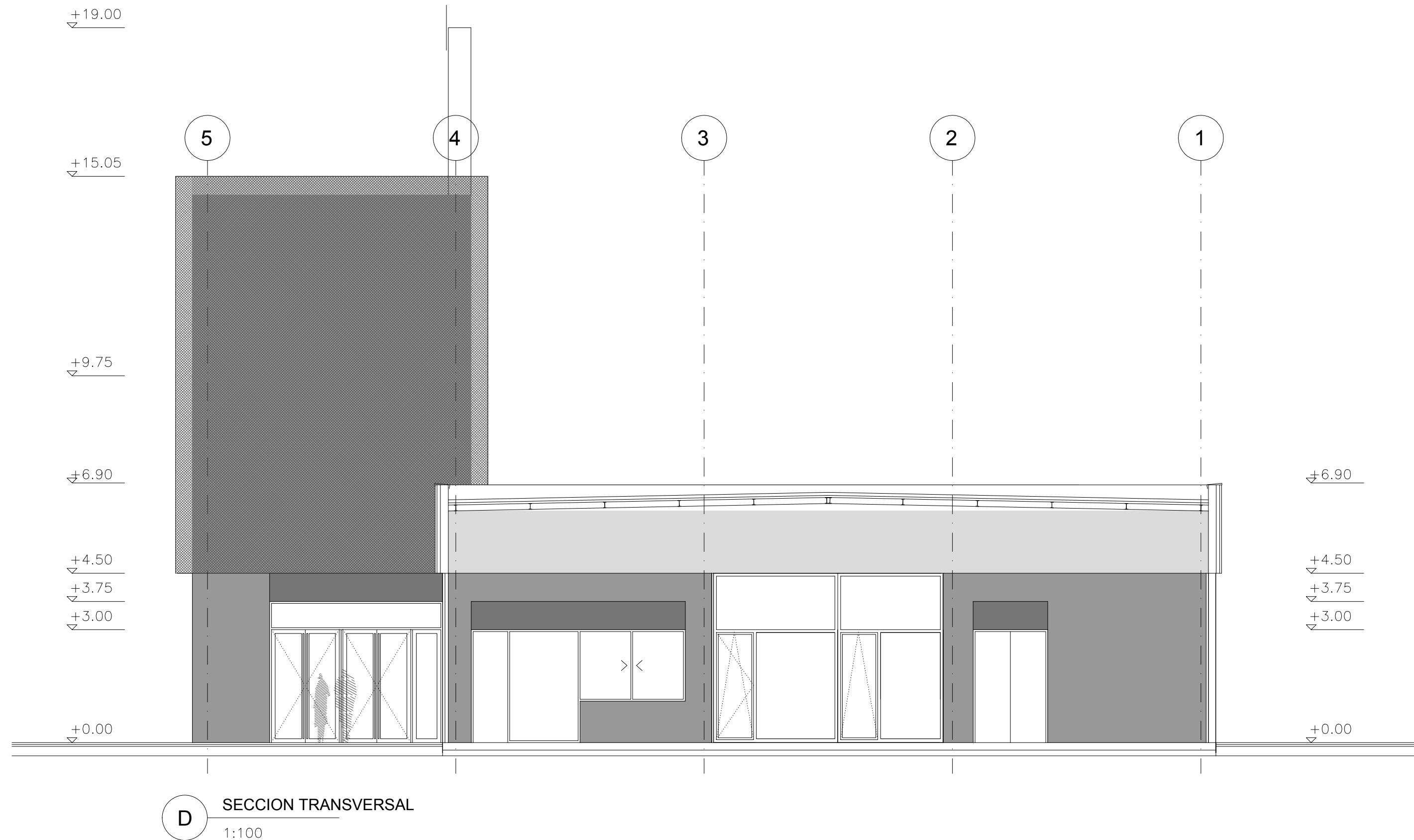
D SECCION TRANSVERSAL 1:100