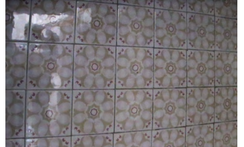
La casa de tus sueños. Videoinstalación, 300 x 260 x 250