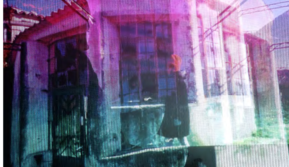
La casa triste. Videoinstalación, 400 x 200 x 250

Los albergues languidieron durante la dictadura y fueron olvidados en la democracia, se trata de un patrimonio hoy ignorado y sin ningún tipo de protección jurídica institucional, que intentaré recuperar aunque solo sea de una forma moral a través del Arte. Este proyecto me ha sacudido desde el primer día que tuve conocimiento de estos albergues perdidos, en parte con emoción, pero también con preocupación; no solo por los edificios, sino por lo que significaron en la Historia de este país, donde la Institución Libre de Enseñanza era un sistema educativo puntero a nivel mundial, donde la Residencia de Estudiantes era uno de los focos más importantes de Cultura y Ciencia de toda Europa, y donde la democracia era la máxima expresión de la belleza. Todavía albergo esperanzas en que podamos reconstruir parte de nuestro patrimonio olvidado, no solo el cultural, también el humano.