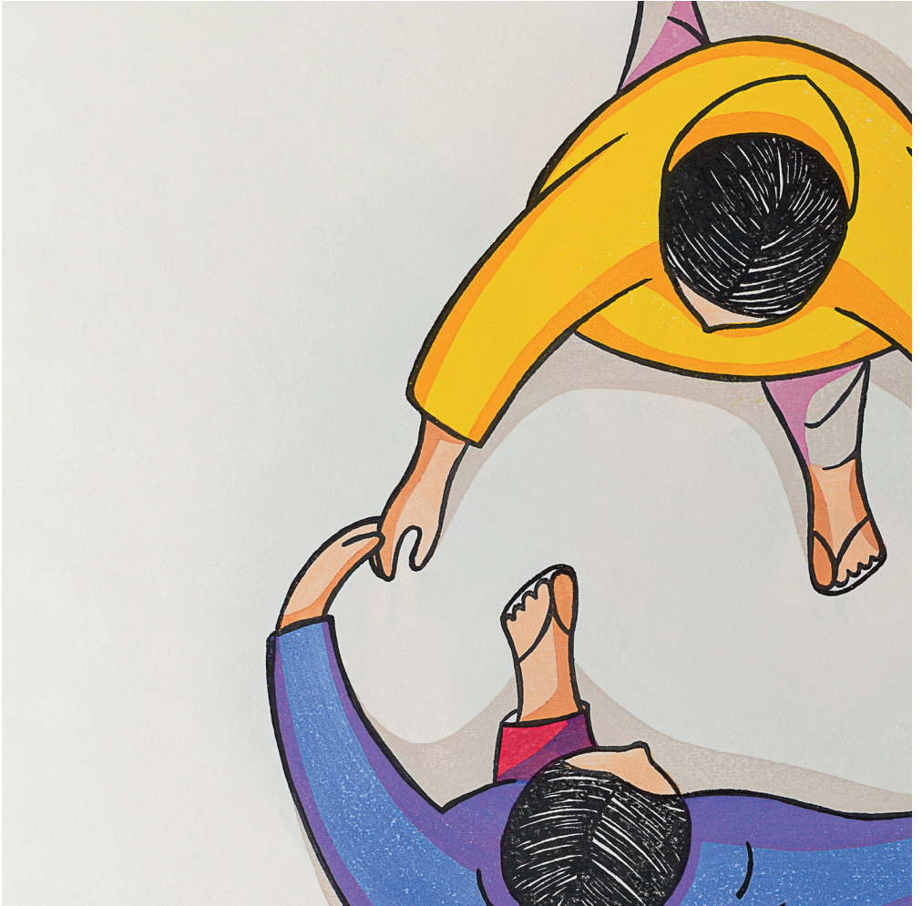
Detalle. Llegaste , 2018, mokuhanga