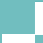
Imagen portada: Estoy pensando , 2017, mokuhanga

El acceso del público se interrumpe 15 minutos antes del cierre de la exposición