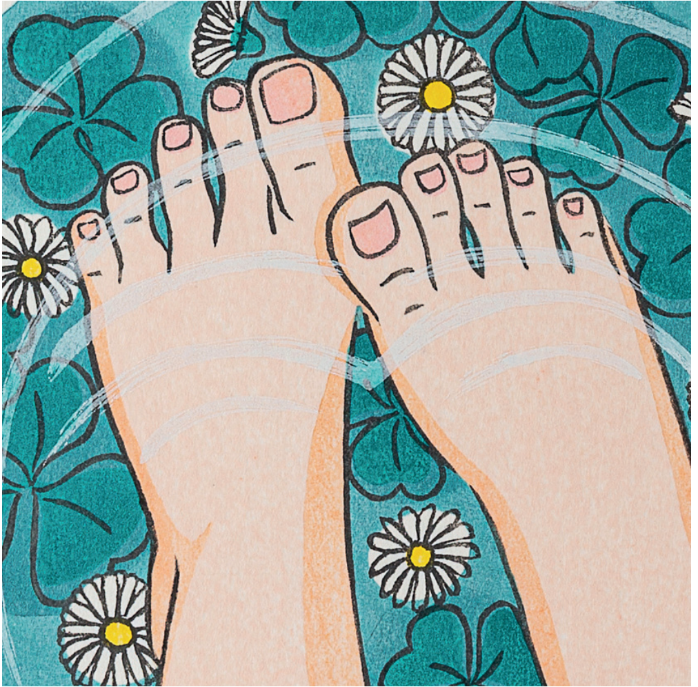
Detalle. Nada es como antes , 2019, mokuhanga