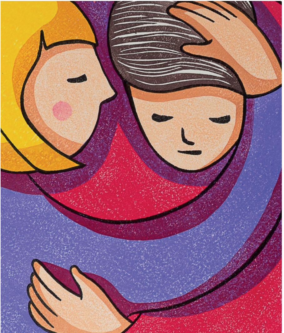
Detalle. Estoy aquí , 2018, mokuhanga