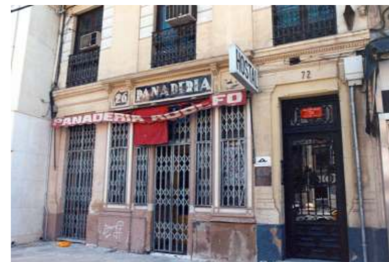
Exterior del local en 1992

BIBLIOGRAFÍA: MARTÍNEZ VERÓN, J., Arquitectura aragonesa: 1885-1920. Ante el umbral de la modernidad . Zaragoza 1993.