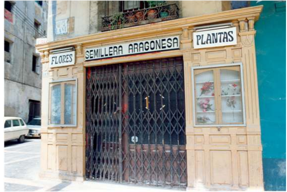
Exterior del local en 1992