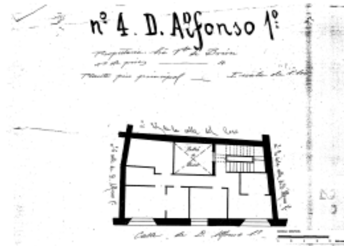
PLANO PARCELARIO DE ZARAGOZA Dionisio Casañal Zapatero