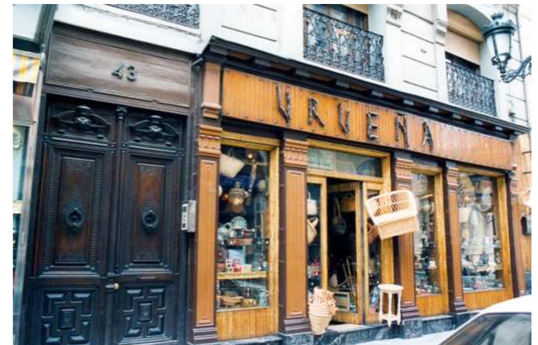
Exterior del local en 1992

INTERVENCIONES PERMITIDAS: RESTAURACIÓN ELEMENTOS A CONSERVAR: FACHADA